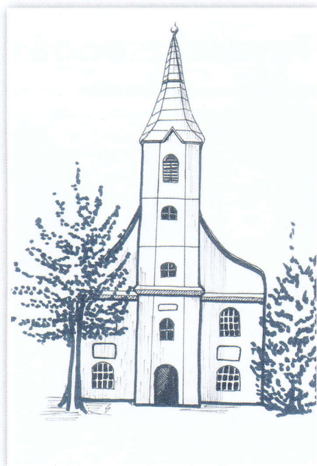
A büki versek kísérő rajza

Mint éhezőnek egy falat kenyér, Mint szomjazónak a forrásvíz, Melytől új erőt remél, Mint égről a csillagok, Ha a Nap nem ragyog. Mint eltévedt embernek az iránytű Mint legelésző nyájnak a zsenge fű. Mint madár, ha be van zárva, Hiányzik a szabadsága. Mint reményvesztett kapaszkodik Utolsó szalmaszálba, Úgy hiányzik anyám szerető jósága.